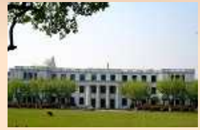
華東師範大学 (コンピュータ科)