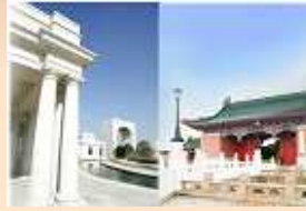
上海交通大学 (関行キャンパス)

紫竹工業園区内にある提携大学へのご案内。 中国の最新IT教育をご見学いただけます。