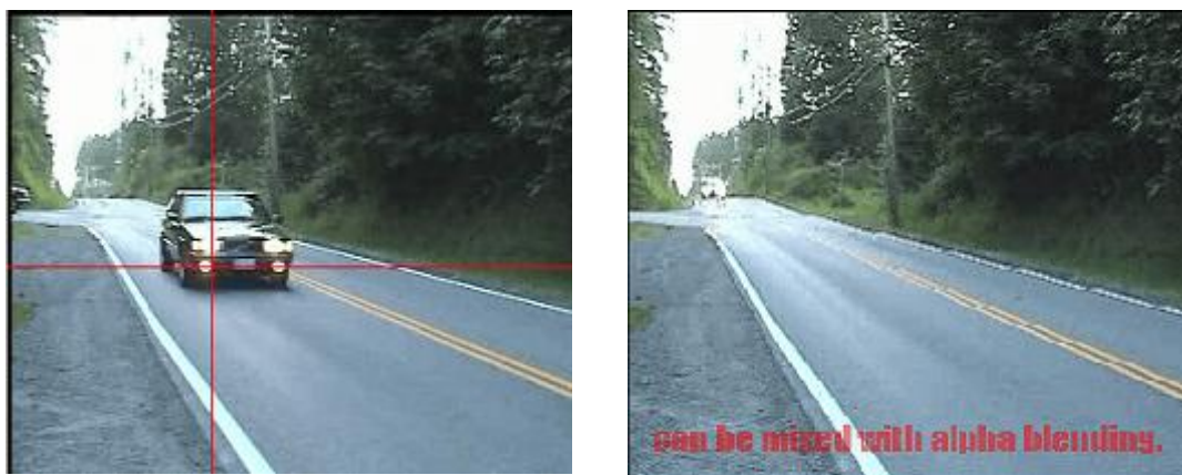
動画のズームング & マーキング & テキストのオーバーレイ