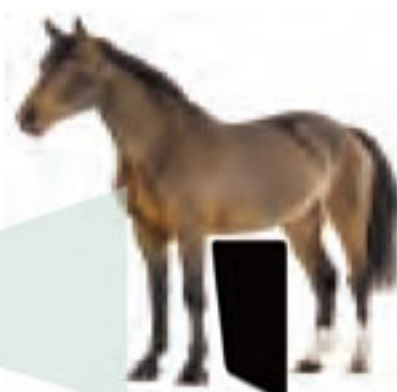
ビットストロング EQXI-DR