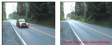
動画のズームング&マーキング & テキストのオーバーレイ